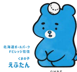
北海道ボールパーク Fビレッジ在住 くまの子 えふたん

Fビレッジ内の施設は2月末まで「tower eleven onsen & sauna」と「tower eleven hotel」をのぞき、毎週火曜は全館休業しています。営業時間が変更となっている施設も多いため、お越しの際は公式サイトのご確認願います。